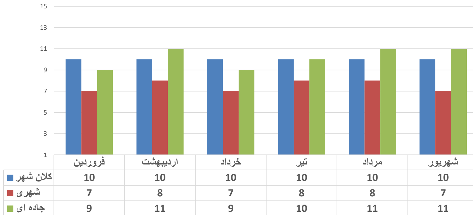
متوسط زمان رسیدن بر بالین بیمار